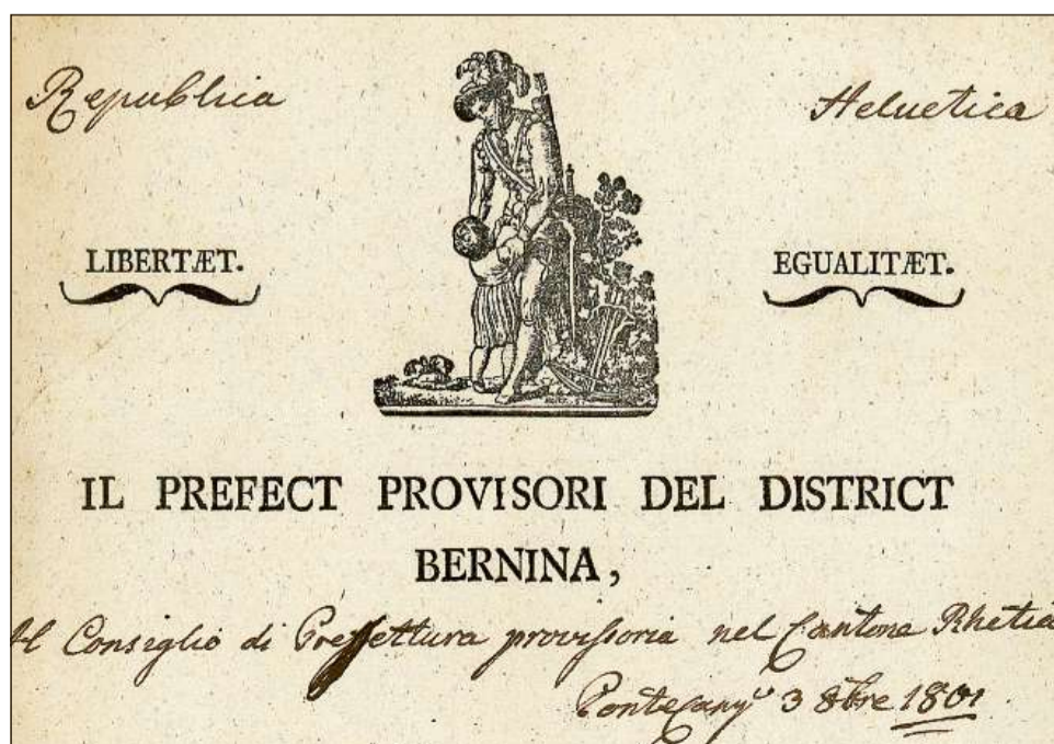
Chau da brev dal temp dal Cussegl da prefectura.